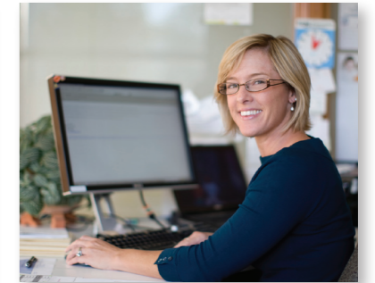
...oder - ganz klassisch - im Büro.