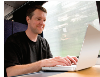
...zum Beispiel im Zug...