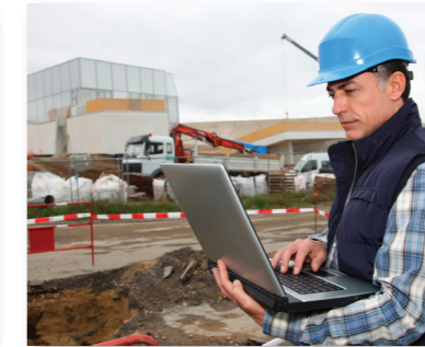
...oder auf der Baustelle...